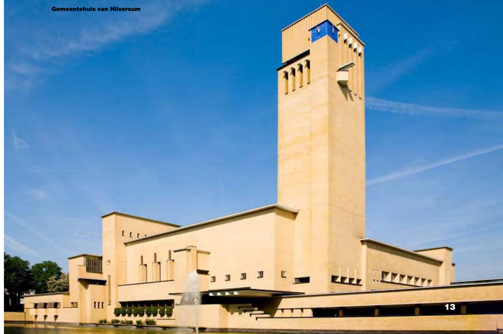
Gemeentehuis van Hilversum