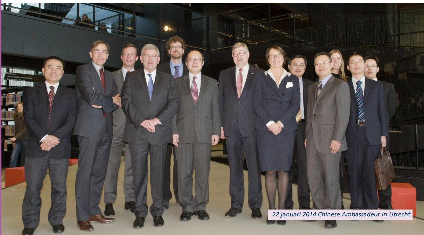
22 januari 2014 Chinese Ambassadeur in Utrecht

Op verschillende onderwerpen kunnen we met verschillende steden contact hebben. Daarbij kijken we ook als gemeente naar wie de internationale contacten van onze partners zijn. Het UMCU werkt bijvoorbeeld veel samen met de