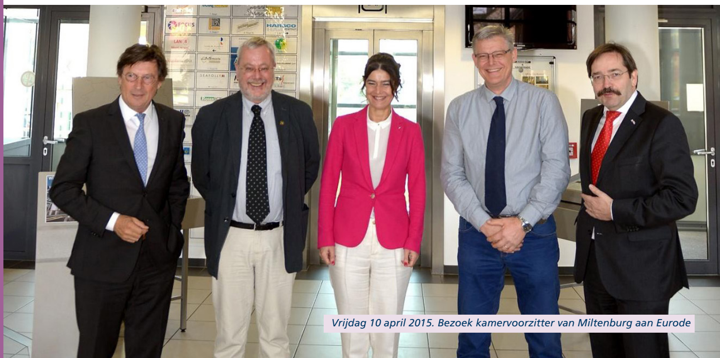
Vrijdag 10 april 2015. Bezoek kamervoorzitter van Miltenburg aan Eurode

Internationaal merken we gelukkig dat er op allerlei manieren steeds meer aandacht komt voor grensgebieden. Kerkrade neemt via de gemeenschappelijke regeling Parkstad Limburg deel aan Charlemagne Grensregio, een grensoverschrijdend samenwerkingsverband tussen gemeenten en regionale overheden, gelegen rond het drielandenpunt. En ook de Euregio Maas-Rijn is in deze regio actief. Ik vertel het in deze volgorde omdat ik vind dat je moet beginnen bij kleine, tastbare dingen. Er wordt veel in algemene termen gesproken over internationalisering en grensoverschrijdende samenwerking, maar als je vraagt wat men heeft gedaan blijft het stil. Je moet kijken naar kleine dingen, of het nu