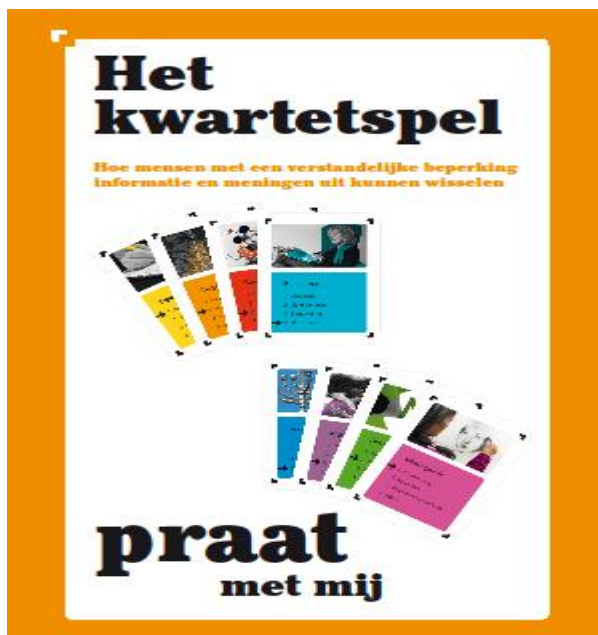
Informatie/communicatie kwartet spel "Praat met mij"

Bij de onderwerpen 24, 25 en 26 geven de ervaringsdeskundigen van de werkgroep ViP en het G-Krachtpanel aan zitting te willen nemen in testpanels die de gemeentelijke informatie en communicatie van de gemeente gaan beoordelen.