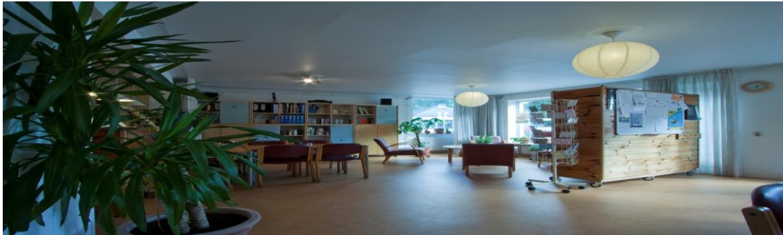
Inloophuis de Ruimte

Wij willen dat vrije inloophuizen in de wijk inclusief gemaakt worden en dat ze, waar mogelijk, in aantal worden uitgebreid. Wij willen ook dat deze meer bekendheid krijgen. Zondag openstelling is een grote wens. Wij willen onderzocht hebben hoe in de openbare ruimte meer informele rust- en ontmoetingsplekken kunnen worden gecreëerd, die voor iedereen het sociaal contact kunnen bevorderen (knooppunten en parken).