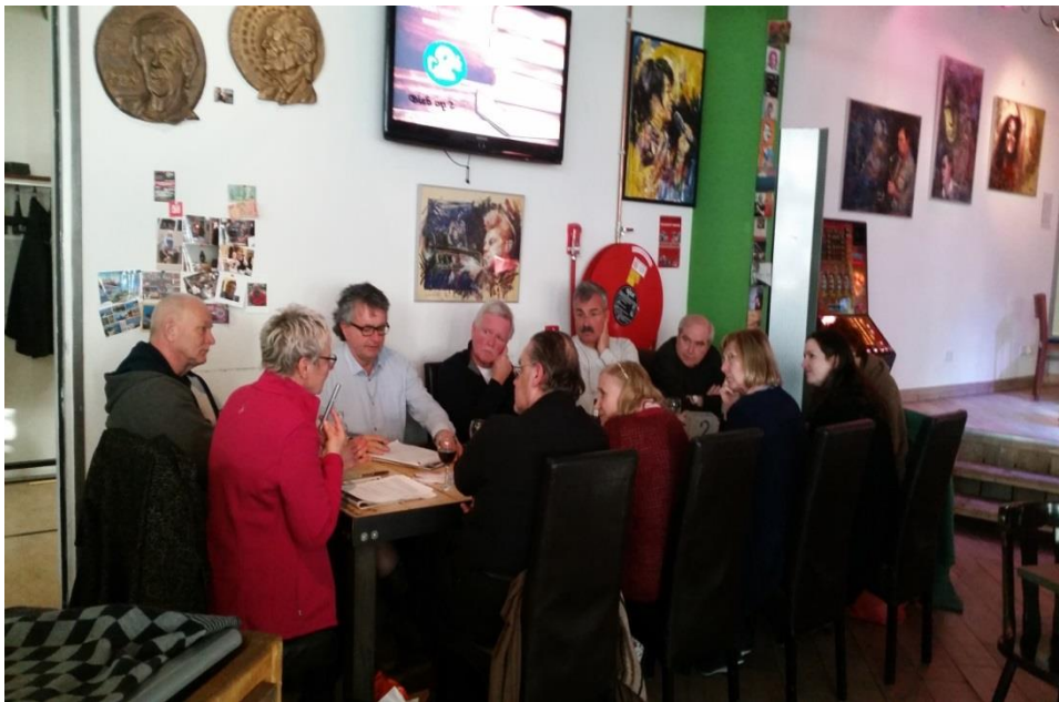
Maandelijks ViP-Inclusie Café op 2

Het eerste en belangrijkste doel is om het begrip voor mensen met een beperking te vergroten, omdat veel Almeerders zich niet realiseren waar mensen met een beperking mee te maken hebben of krijgen. Via een publiciteits-/bewustwordingscampagne dient de Almeerse Inclusie Agenda bij alle Almeerse inwoners onder de aandacht te worden gebracht. De gemeentelijke medewerkers moeten zich realiseren dat het onderwerp Inclusie een bijzonder belang kent en op alle mogelijke beleidsterreinen van de gemeente moet worden meegenomen. De werkgroep ViP zou graag zien dat de politieke ambtsdragers van de gemeente, maar ook de gemeentelijke medewerkers ambassadeurs van de Inclusie Agenda worden.