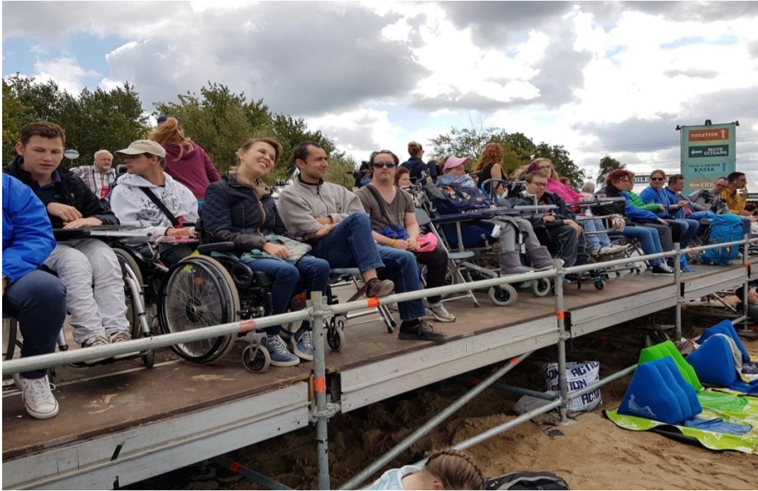
Evenement "Zand Almere"