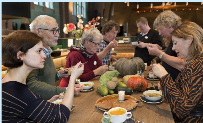
De viering van Wereldvoedseldag in samenwerking met zorgcentrum Park Vossenberg

De borging van de Global Goals in de gemeente werd belegd bij burgerplatform Stichting Wereldgemeente Loon op Zand. Zij hebben gesprekstafels opgesteld om kernthema's te identificeren. De thema's – huis en energie, hergebruik en voedsel – zijn de basis geworden voor werkgroepen. Eerlijke handel als kernidentiteit voor de gemeente is, net als de Global Goals, een rode draad binnen de werkgroepen. Bij afwegingen binnen de thema's wordt getoetst of deze geen negatieve gevolgen hebben voor andere duurzaamheidsdoelstellingen.