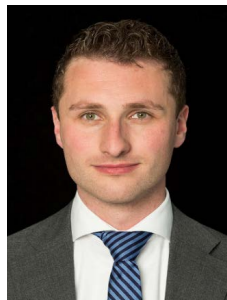
Bastiaan Wallage lid