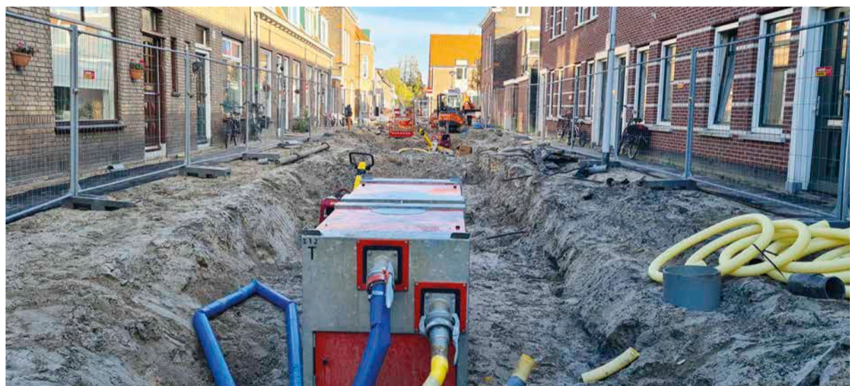
Vervanging riolering Noorderkwartier-oost