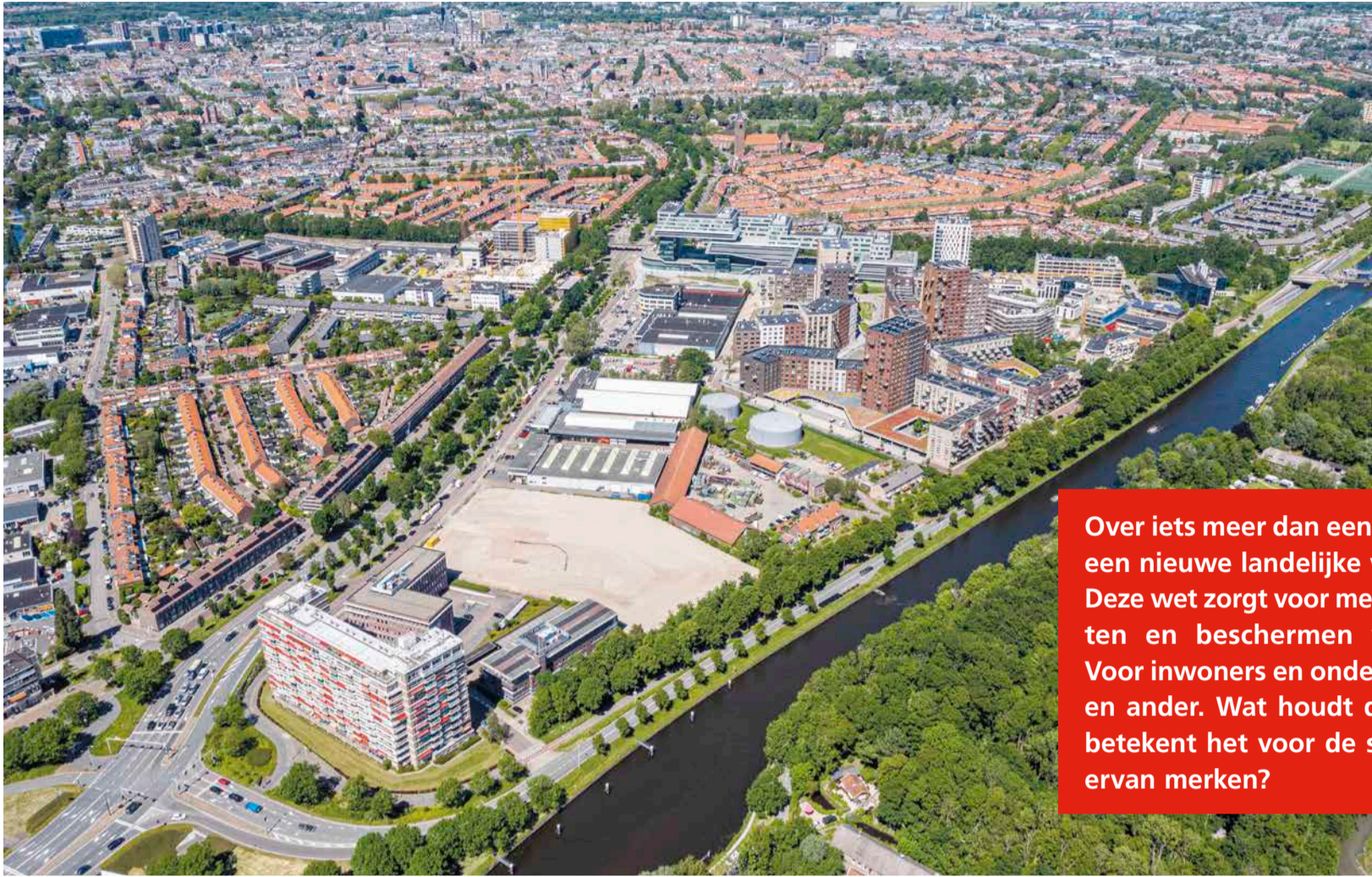
De Lammenschansdriehoek vanuit de lucht

Fleur Spijker (wethouder Duurzame Verstedelijking):