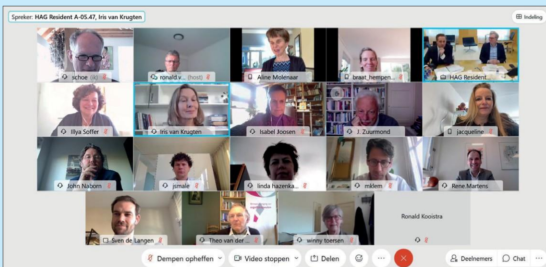
Het digitale Bestuurlijke Overleg van 5 maart jl. onder leiding van de Minister.