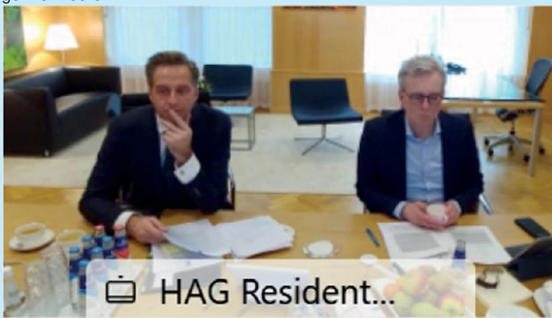
De Minister en de DG aan de vergadertafel van het Bestuurlijk Overleg op 5 maart jl.

Dus zet alvast in de agenda: Congres 10 juni 2021 van 15.00 uur tot 17.00 uur . De voorinschrijving start binnenkort. Daarover worden alle deelnemers van dit project, én hun achterban, geïnformeerd.