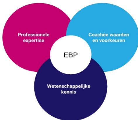
Figuur 2: Evidence Based Practice 27

Dit recidive-model heeft als doel ervoor te zorgen dat beleidsmakers gemakkelijk kennis en onderbouwing kunnen vinden voor hun recidivebeleid. Verschillende beleidsambtenaren hebben zich met dit model beziggehouden en hebben het uitgebreid bekeken. Men kan daarom concluderen dat dit model evidence based is.