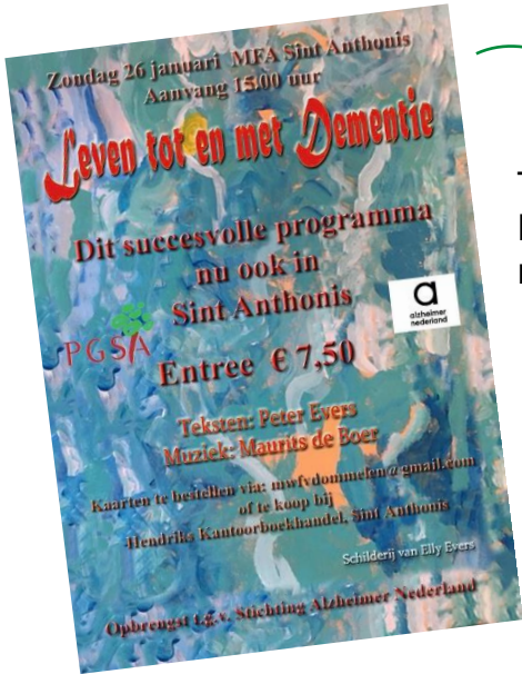
Theatervoorstelling Leven tot en met dementie