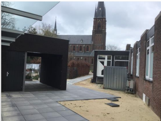
Nieuw toegankelijk pad naar het Kerkplein in Warroij