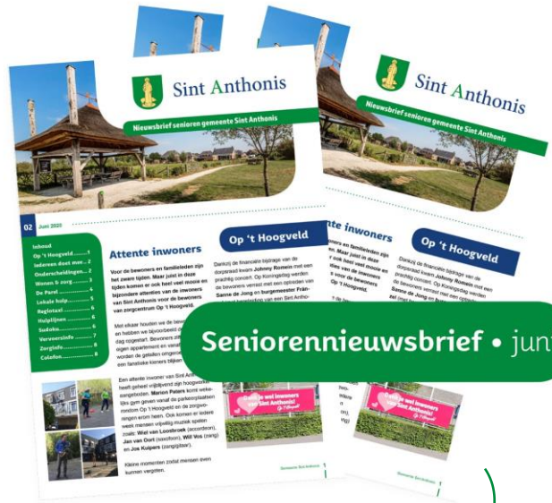
Seniorenniewsbrief • juni