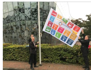
Alphen aan den Rijn 2019