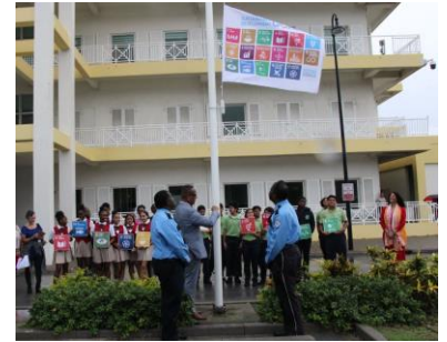
Sint Maarten 2019

Hoe meer gemeenten meedoen, hoe zichtbaarder onze gemeenschappelijke actie. Laat ons via uw registratie weten hoe u van plan bent om mee te doen!