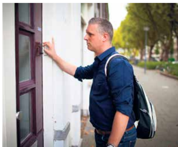
Anton: 'Als wijkteam willen we mensen zelfredzaam maken.'

ondersteuning die nodig is en dit wordt vastgelegd in een ondersteuningsplan.