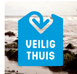
Op een foto, kleur