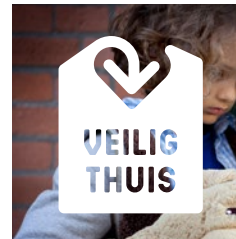
Op een foto, diapositief