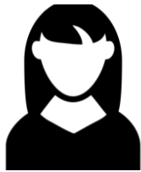
Tanya Problematische schulden