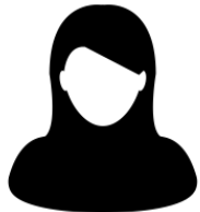
Halima Nog geen problematische schulden