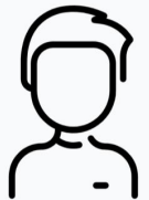
Ronald Psychische problemen en problematische schulden