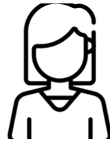
Ada Coach/ |regisseur