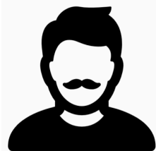
Patrick Zit als tweeverdiener ineens krap