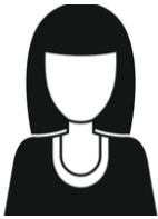
Ellis Nog geen problematische schulden