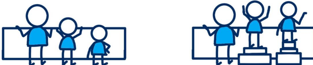
Figuur 1: Brede ondersteuning is maatwerk

Gemeenten staan rechthebbenden bij die in aanmerking komen voor de brede ondersteuning. Brede ondersteuning biedt aan hen de mogelijkheid tot het kunnen maken van de nieuwe start die nodig is om (emotioneel) te herstellen van de gevolgen die zij ondervinden van het toeslagenschandaal. De ondersteuning is vrijblijvend. Dat betekent dat de rechthebbende de regie heeft om al dan niet gebruik te maken van het ondersteuningsaanbod via de gemeente.