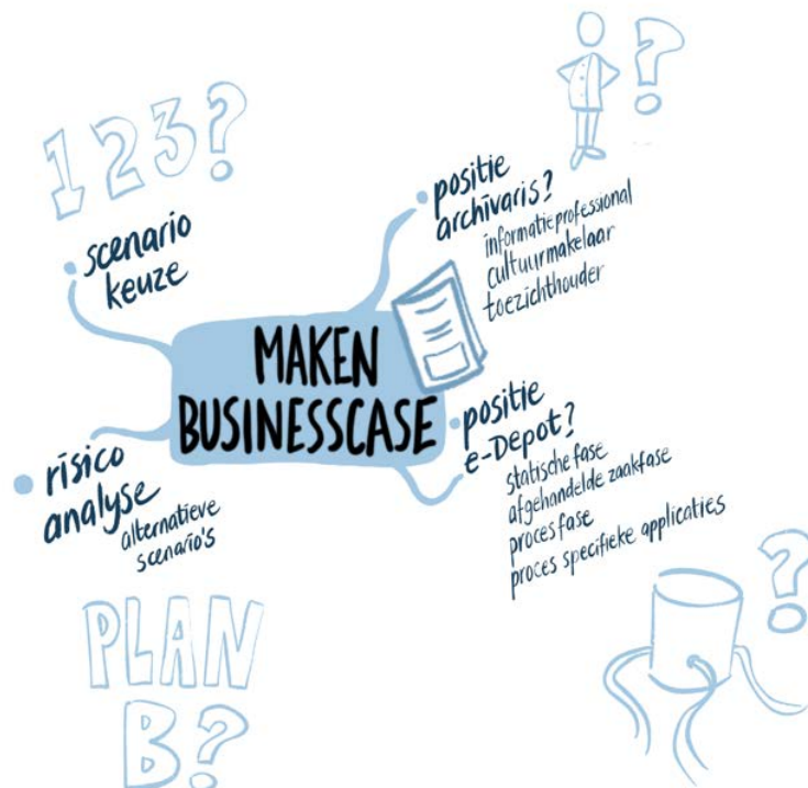
Figuur 2: schematische weergave businesscase duurzaam archiveren

Er is geen standaardmodel voor het opstellen van een businesscase, omdat de vragen die beantwoord moeten worden per casus heel verschillende kunnen zijn. Wel is er een minimaal aantal onderwerpen dat in de businesscase aan de orde moeten komen. De onderwerpen die in de businesscase aan de orde komen zijn hieronder uitgewerkt en dit kan voor het maken van de businesscase als leidraad dienen