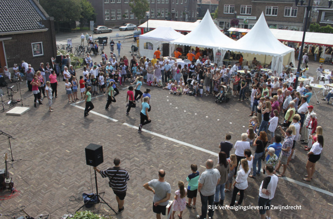
Rijk verenigingsleven in Zwijndrecht

Wat ik het belangrijkste pluspunt vind van een coalitieloos college is dat bij discussies in de raad de kaarten niet bij voorbaat al geschud zijn. Dit maakt de raadsvergaderingen interessanter. Terwijl vroeger een motie of amendement van de oppositie bij voorbaat kansloos was wordt nu gestemd vanuit eigen politieke overtuiging en dat wat goed is voor Zwijndrecht!