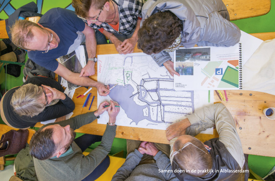
Samen doen in de praktijk in Alblasserdam

Samenspel met inwoners is onmisbaar voor een succesvol gemeentebestuur. De gemeente is niet van de bestuurders maar van de inwoners. In Alblasserdam ontwikkelen we ons vanuit dit besef steeds door. De inhoudelijke agenda, de organisatieontwikkeling en de bestuursstijl lopen gelijk op. In 2014 ontwikkelden we met de samenleving onze Samenlevingsagenda . Gepassioneerde wethouders die dat in nauwe samenwerking met de raad consistent en met verve uitdragen en uitvoeren zijn cruciaal. Helderheid over waar wel en waar geen samenspraak mogelijk is en heldere transparante communicatie ook. Ik wens u veel inspiratie en goed bestuur toe samen met uw inwoners!