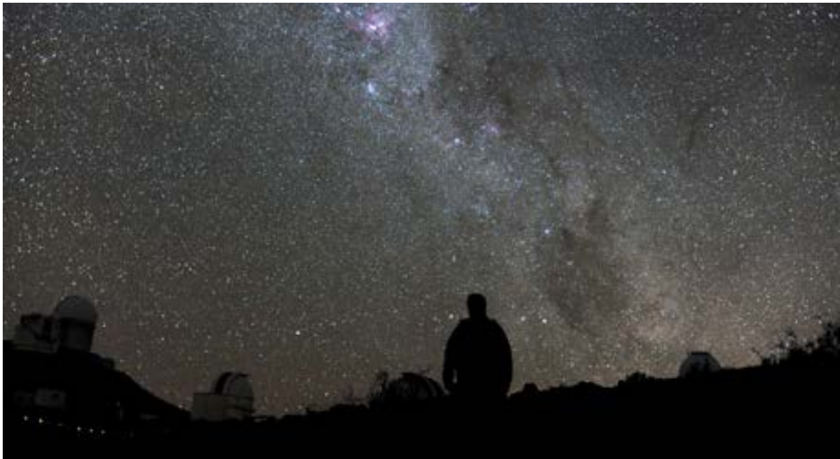
In Nederland is de Melkweg niet meer te zien door lichtvervuiling

Door de overdaad aan licht is in Nederland slechts een beperkte sterrenhemel te zien. Voldoende duisternis is een oerwaarde en heeft tevens een positief effect op de gezondheid en het welzijn van mensen en dieren. In verschillende onderzoeken zijn er relaties gelegd tussen kunstlicht, slaapstoornissen en stress. Uit onderzoek blijkt tevens dat veel Nederlanders lichthinder ervaren. Te denken valt aan lantaarnpalen of reclameverlichting van kantoren dicht bij slaapkamerramen. Een derde van alle mensen op aarde kan 's nachts de Melkweg niet meer zien door lichtvervuiling. Wetenschappers maakten een kaart met de gebieden waar de Melkweg niet langer zichtbaar is vanaf de aarde. Ook in Nederland is de Melkweg niet meer te zien.