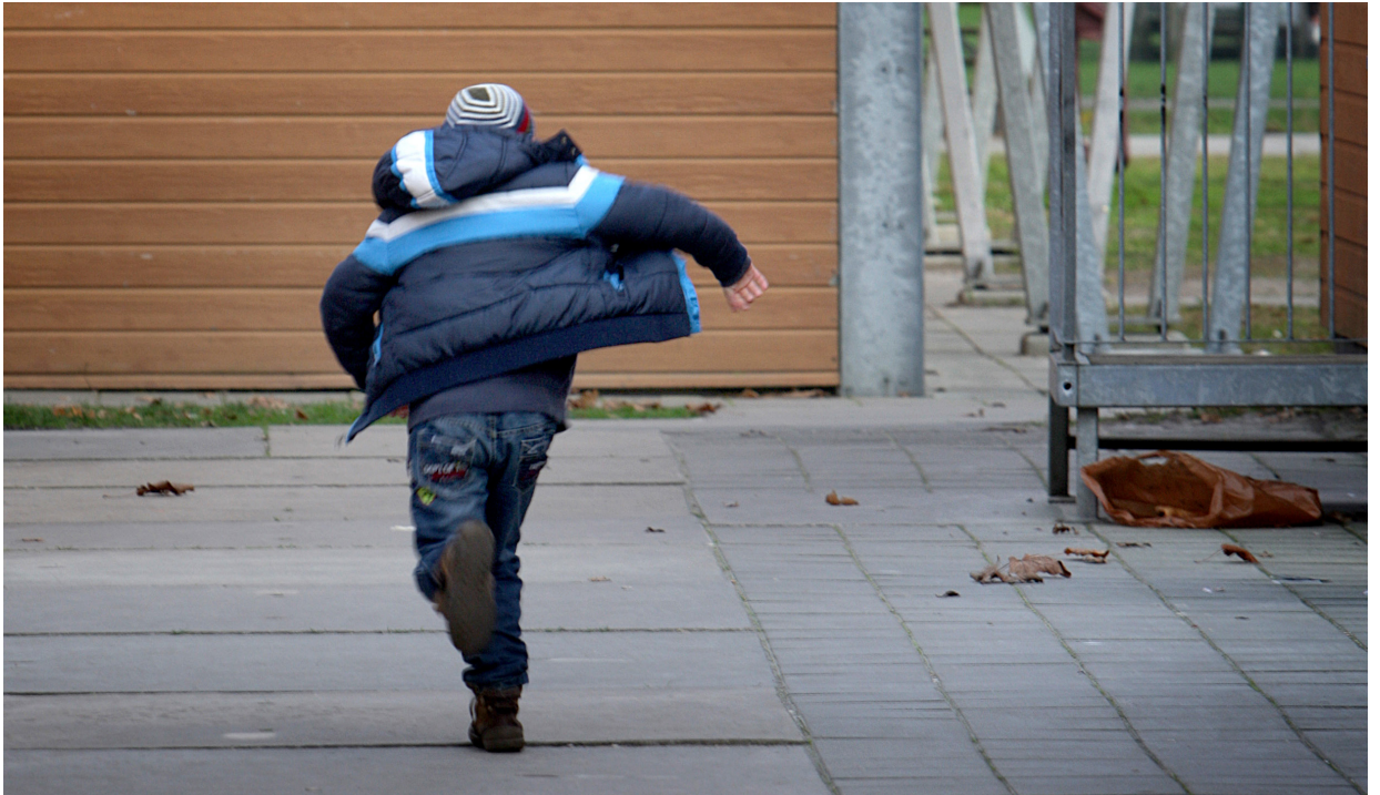
Ministerie van Veiligheid en Justitie